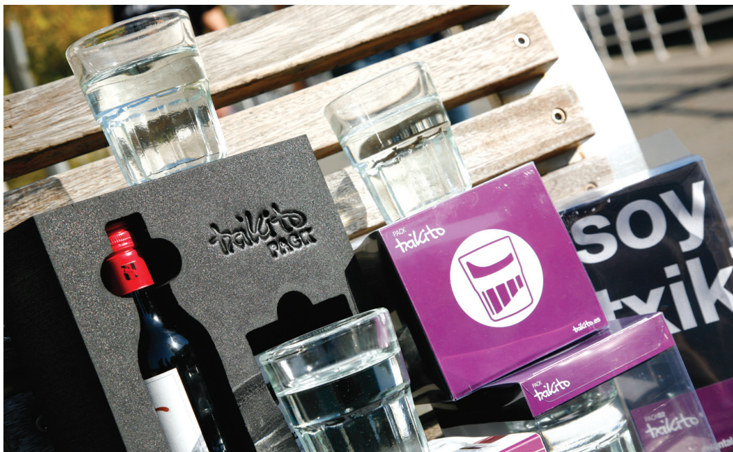
La historia, tradición, originalidad y fabricación artesanal lo convierten en un recuerdo único de Bilbao